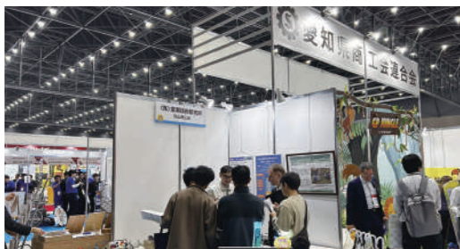
昨年の「メッセナゴヤ2025」の様子

令和8年11月1日(水)～13日(金)に「メッセナゴヤ2026」が開催されますが、商工会では今回も出展される事業所様への支援を考えています。つきましては、その為の出展意向の確認を行いますので、同封チラシをご確認のうえ、ご希望の方はご回答ください。