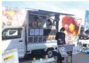
〈実際のキッチンカー出店風景〉

守山区内で事業を営む 会員様に軽トラの キッチンカーを無償で お貸出いたします。