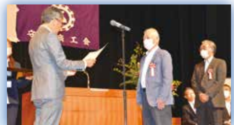
●総代会に先立ち「支部等役員功労者」への感謝状の贈呈も行われました。