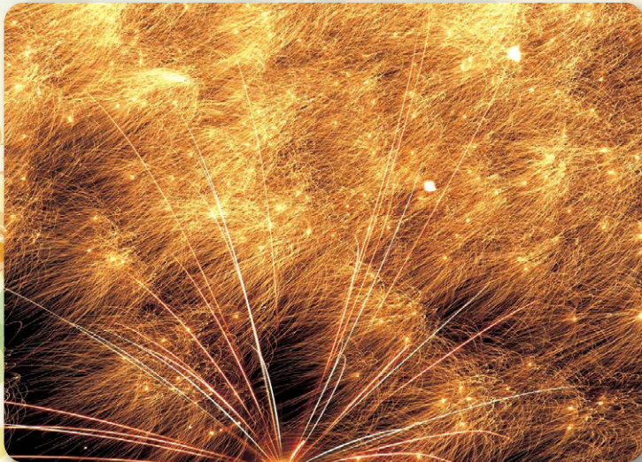
▲写真は過去の志段味納涼夏祭りの様子